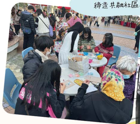
計劃成功打破種族隔膜，締造共融社區。