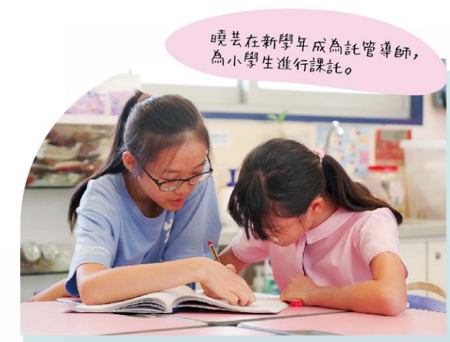
曉芸在新學年成為託管導師，為小學生進行課託。

長，長者、婦女及家長的照料經驗固然豐富，由中學生充當大哥哥大姐姐，則能與小學生打成一片。」她讚嘆這班中學生的參與度更是出人意料——計劃共招募388名託管導師，當中多達213名是中學生。