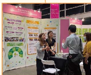
秘書處同事介紹基金的工作。

基金於2024年5月3日參與由香港社會服務聯會舉辦的「S+高峰會暨博覽」，以主題展覽向不同界別的持份者介紹社會資本理念、基金工作及資助計劃。