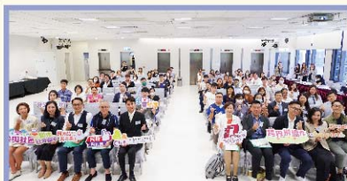
近80位參加者出席活動。