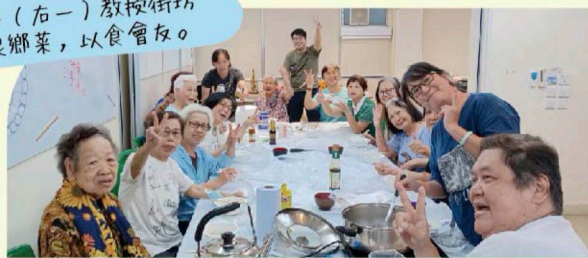
正一(右一)教授街坊煮家鄉菜，以食會友。

正一自言本身較為慢熱，蛻變成今日義工中堅份子，皆因在計劃中認識一班好友。「計劃讓我認識到很多街坊，大家在活動中建立關係，閒時更會相約飲茶，令我開懷了不少。原來做義工不僅幫到人，也幫到自己。」