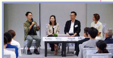
基金資助計劃團隊「竹織耆園」、香港房屋協會及大快活集團有限公司 (由左至右) 的代表分享跨界協作經驗。